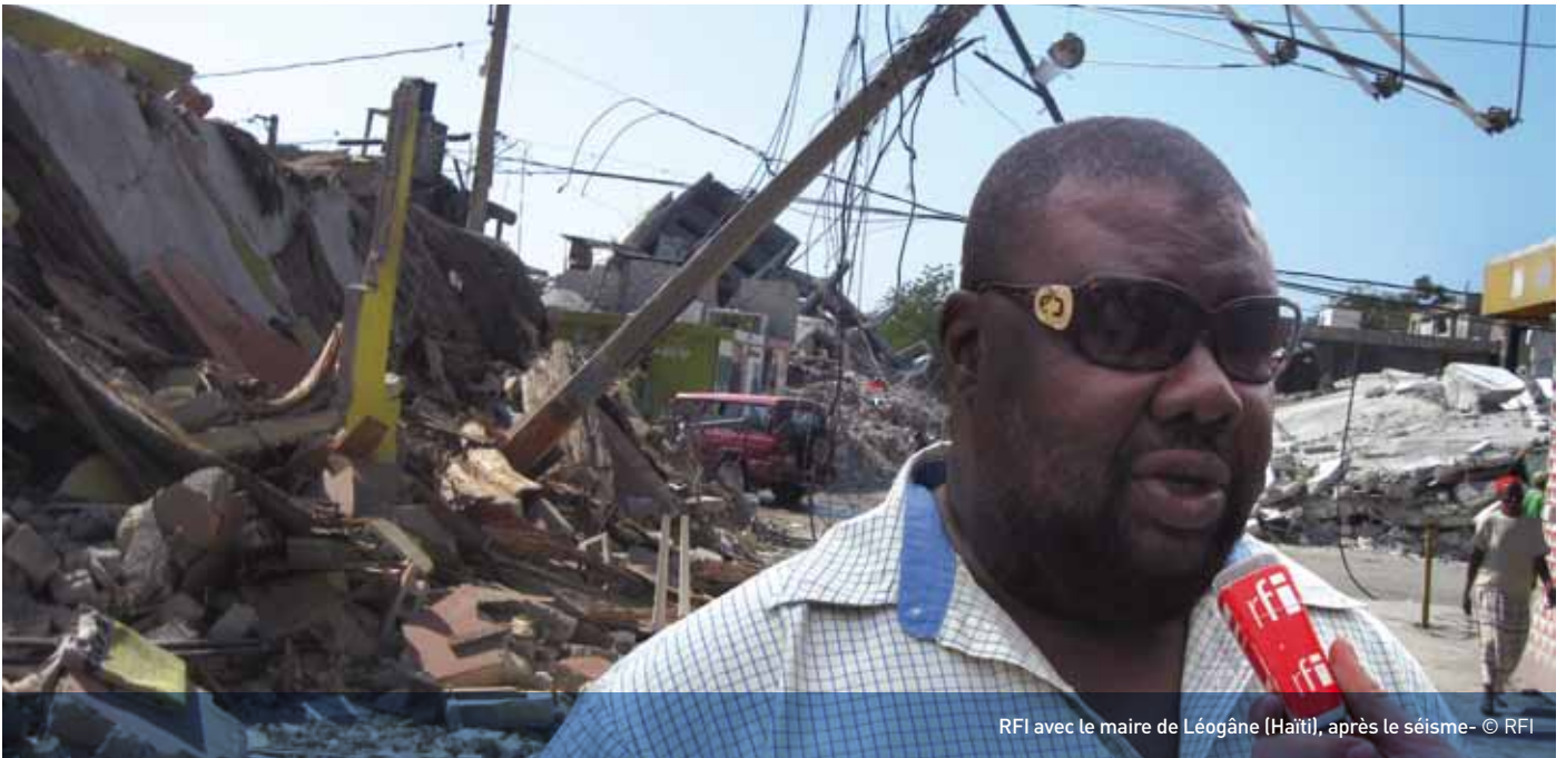
RFI avec le maire de Léogâne (Haïti), après le séisme

La France fait souvent figure de précurseur, et notre pays est très sollicité par ses partenaires étrangers pour réfléchir sur les enjeux nouveaux, comme la lutte contre le piratage, le développement de l'offre numérique légale et la numérisation des salles de cinéma.