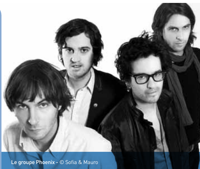
Le groupe Phoenix

La Deutsche Welle et la BBC consacrent également d'importants moyens à leur audiovisuel extérieur. À titre de comparaison, pour la seule BBC Radio, la contribution du Foreign Office permet l'emploi de 4 000 personnes à l'international (contre un peu plus de 1 100 pour RFI).