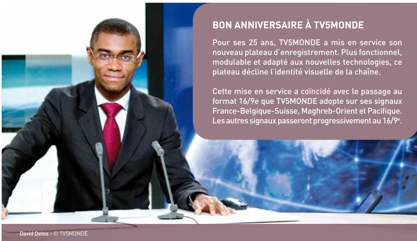
David Delos - © TV5MONDE